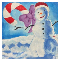
Ryellie, Scarborough Village