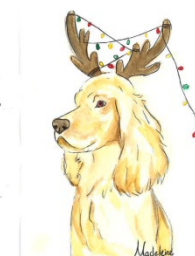
Madeleine, Ville de Québec

L'an dernier, les illustrations de deux élèves Passeport de talent ont été retenues.